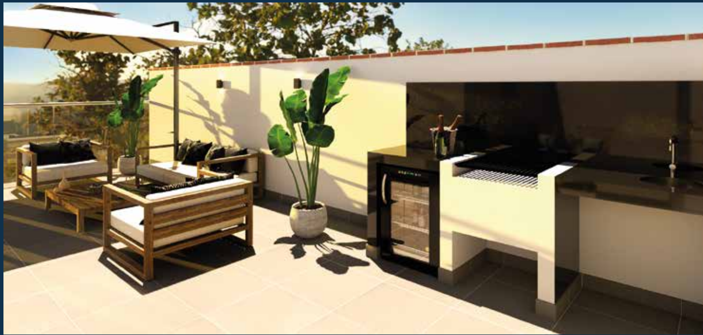
Terraza con parrilla